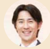
Comments by 里中 憲一