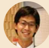
Comments by 中村 拓